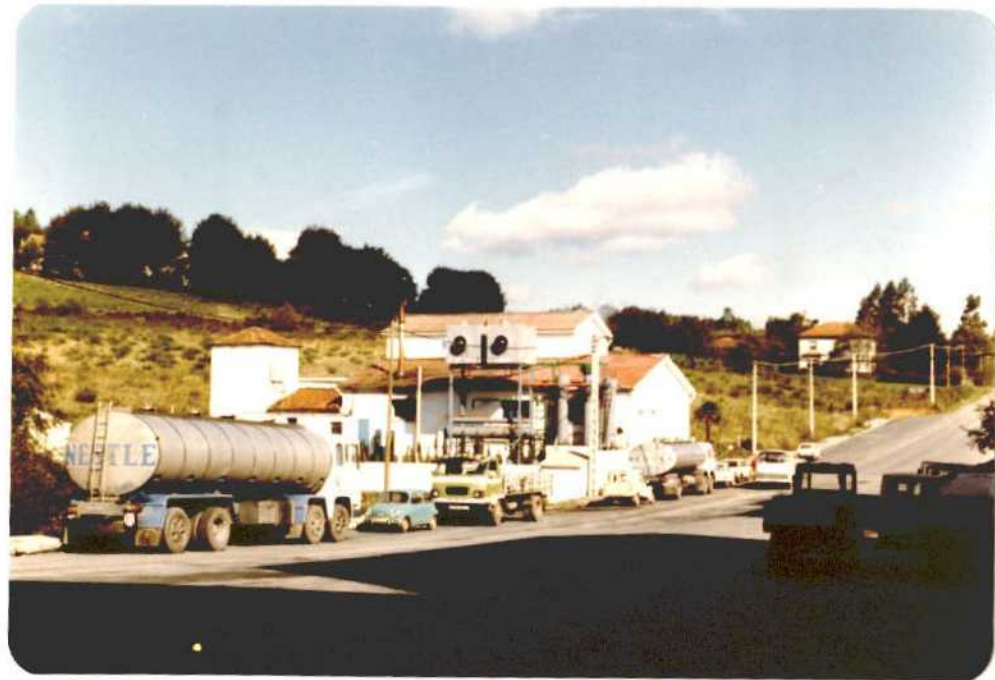
Fotografía núm. 51. Central de preenfriado de leche de NESTLÉ, en Lalín, con una capacidad de 4.250.251 l/mes.

Fotografía núm. 50. Tpermino Municipal de Lalín. Carretera de Lalín a Monforte. Cartel anunciador de las nuevas acciones que se están llevando a cabo. Al fondo dos modernas granjas.