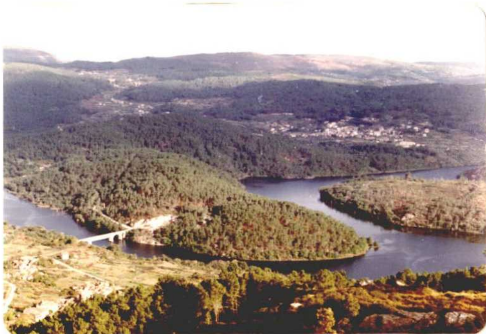
Fotografía núm. 26 Encajonamiento del Miño a su paso por Crecente.

Fotografía núms. 25. Vista de la margen del río Deza y del valle del río Asuerio, límite entre los municipios de Lalín y Silleda, desde el viaducto de la carretera de Orense a -- Santiago. A la derecha la "Cooperativa Hoxe" de transformación de leche. Los bosques son mixtos de frondosas, pinar y eucaliptos.