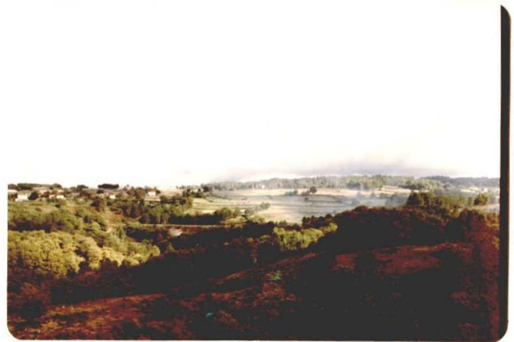
Fotografía núm. 22. El río Deza, hacia su nacimiento, a su paso por la parte sur del término municipal de Lalín.