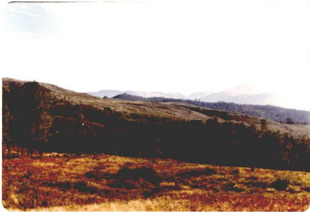
Fotografía núm. 19. Vista desde la carretera de La Cañiza a Cortegada de la zona próxima al río Ribadil, en dirección SE hacia el Miño. Por la loma situada a la izquierda va el límite de los términos de La Cañiza y Creciente.