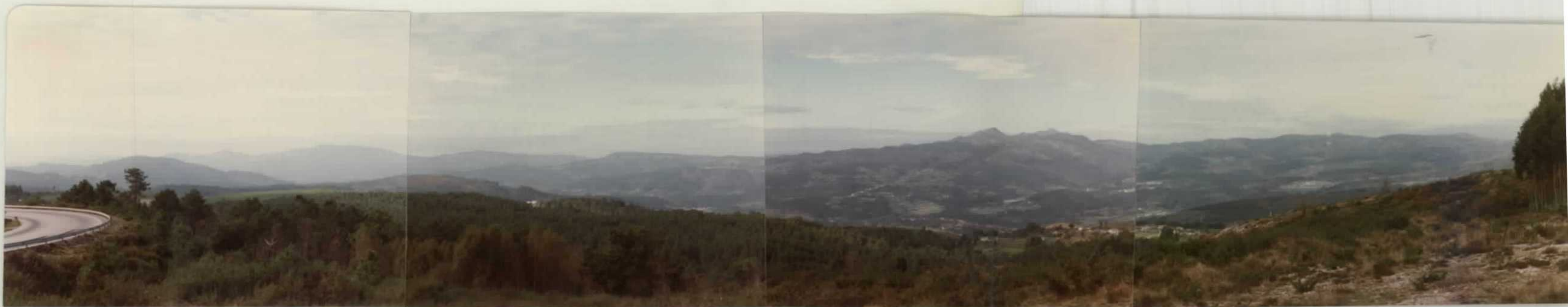
Fotografía núm. 17. Vista panorámica del Valle del Alen, desde el alto de Fontefría. Comprende parte de los municipios de Covelo, Mondariz y Mondariz-Balneario.