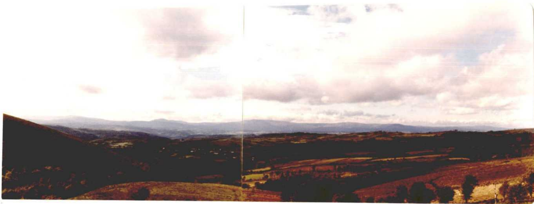
Fotografía núms. 2 Vista panorámica del término municipal de Dozón, desde el Alto de la Rocha.