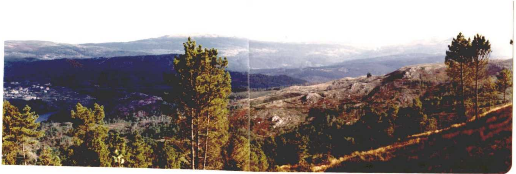
Fotografía núm. 28. Vista de la margen del Miño en las proximidades de Filgueira, término municipal de Creciente.