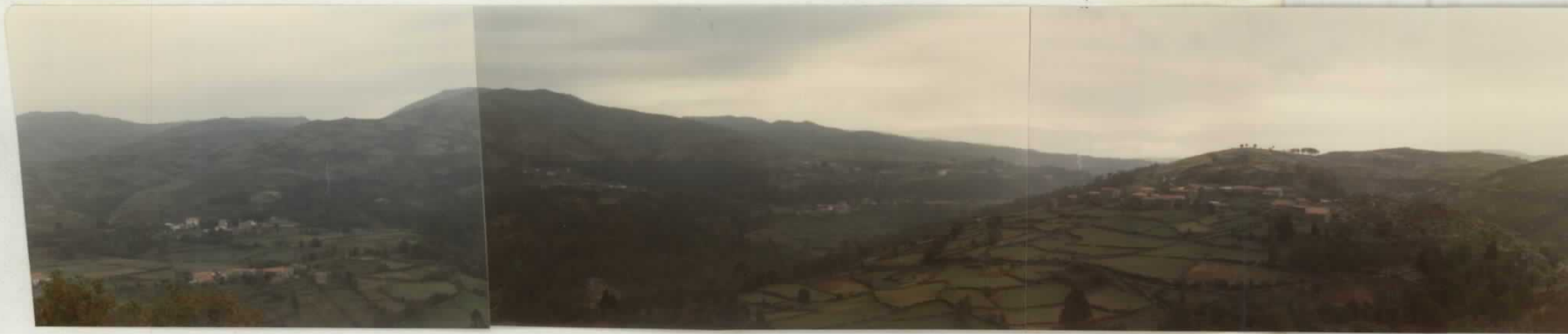
Fotografía núm. 9. Vista panorámica del Valle del Verdugo, siendo este el límite de los términos municipales de La Lama y Cotobad. Al fondo la Sierra de Cando. El aprovechamiento del suelo y las entidades de población se sitúan, a partir de la mitad de la ladera, hacia abajo. Esta nota, es importante destacarla, pues es característica de toda -- la zona central montañosa.