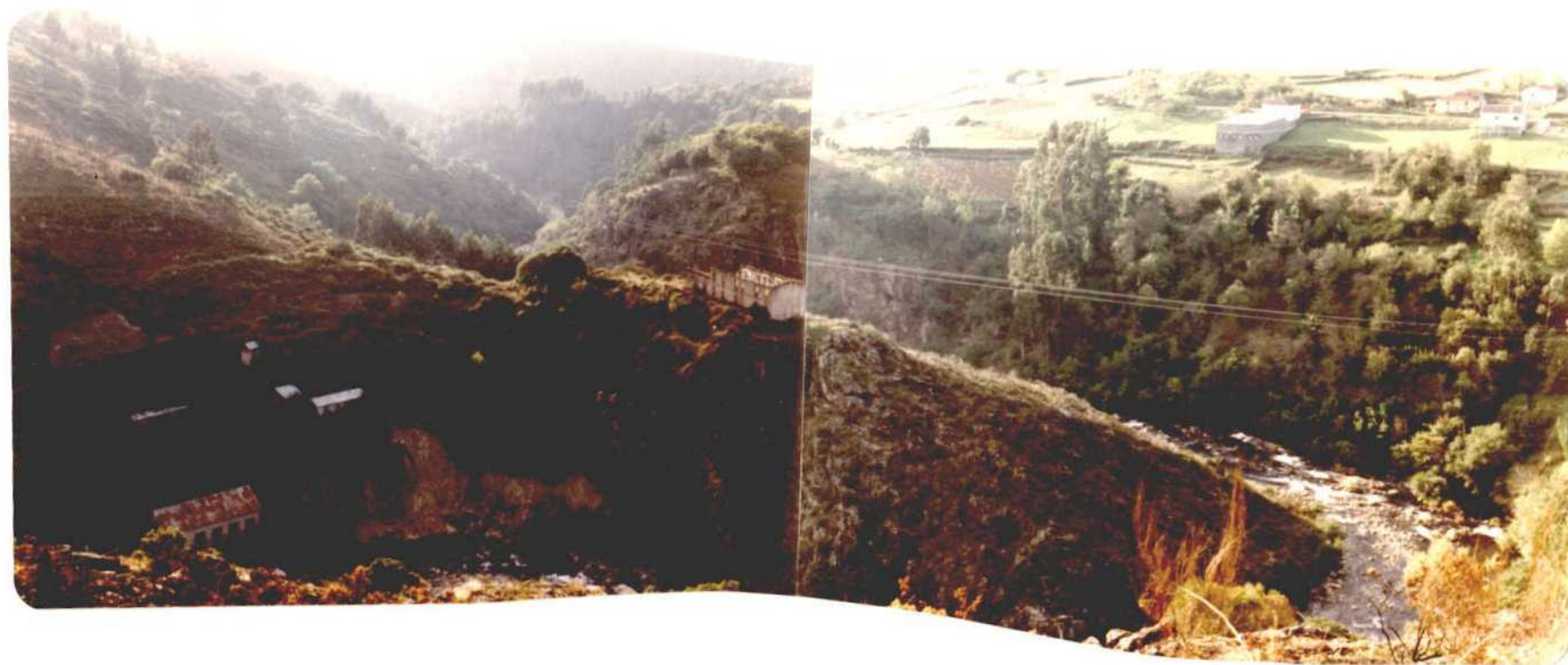
Fotografía núm. 36. Antiguas instalaciones del Grupo Minero Silleda, al pie del río Deza. Pueden verse algunas pequeñas escombreras, correspondientes a pequeñas galerías que se realizaron a este lado del río siguiendo algunos filones.