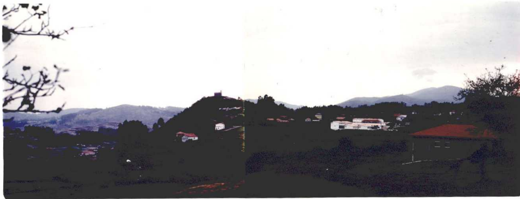
Fotografía núm. 5. Vista del término municipal de La Lama, en su extremo occidental, con la capital municipal al fondo. En primer término un moderno grupo escolar, al que afluyen escolares de todo el municipio.