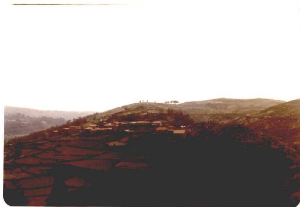
Fotografías 6 y 7. Dos aspectos de Cambeses, aldea del término municipal de La Lama, situada cerca de la intersección de las Sierras del Suido (en primer término) y del Cando (al fondo). Se puede ver la clara diferencia entre la parte alta de los montes, y las laderas, que son aprovechadas en gran cantidad de parcelas, casi hasta el propio cauce del río.