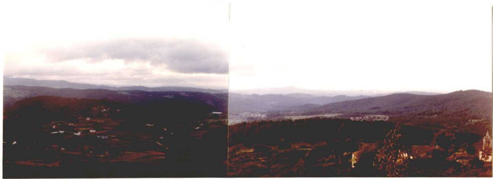
Fotografía núm. 34. Vista panorámica, desde la corta del Grupo Minero Silleda, del valle del Deza hasta su confluencia con el Ulla, términos de Silleda y Villa de Cruces. Al fondo, el Pico Sacro, provincia de La Coruña.