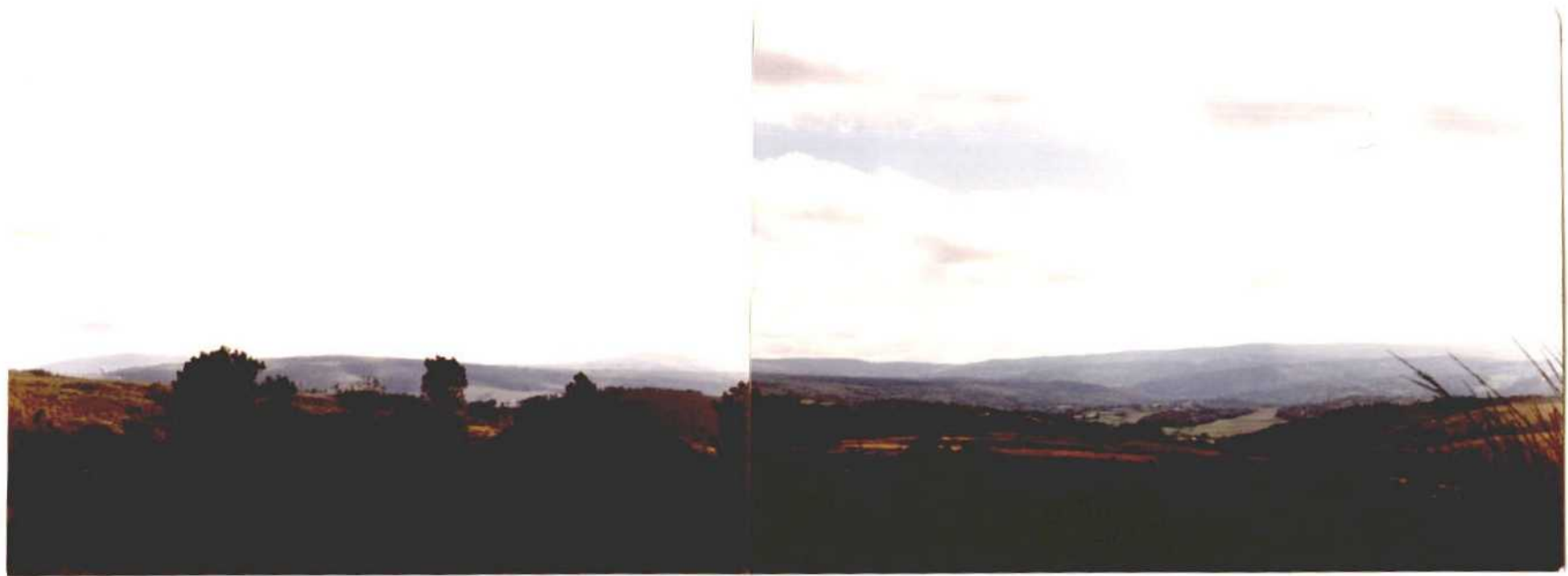
Fotografía núm. 1 Vista panorámica del ángulo sureste de Lalín, limitado por las carreteras de Lalín-Chantada (Izquierda) y Lalín-Orense (derecha).