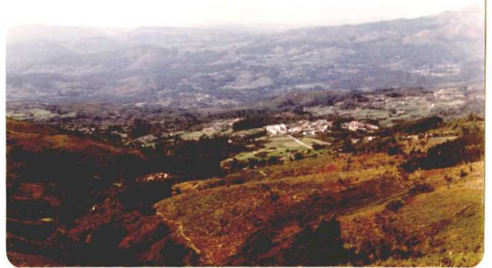
Fotografía núm. 18. Término Municipal de Covelo, desde el Mirador del Alto de Fontefría.