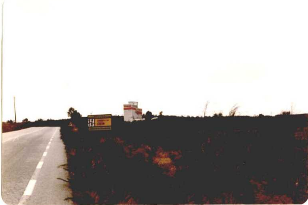
Fotografía núm. 59. Vista de la fábrica de piensos de NUCAMSA. Situada en el término de Lalín, pero practicamente en la confluencia de los términos - de Lalín, Rodeiro y Dozón. La capacidad de esta - instalación es la mayor de toda la comarca, y se - espera que entre en funcionamiento este mismo --- año.