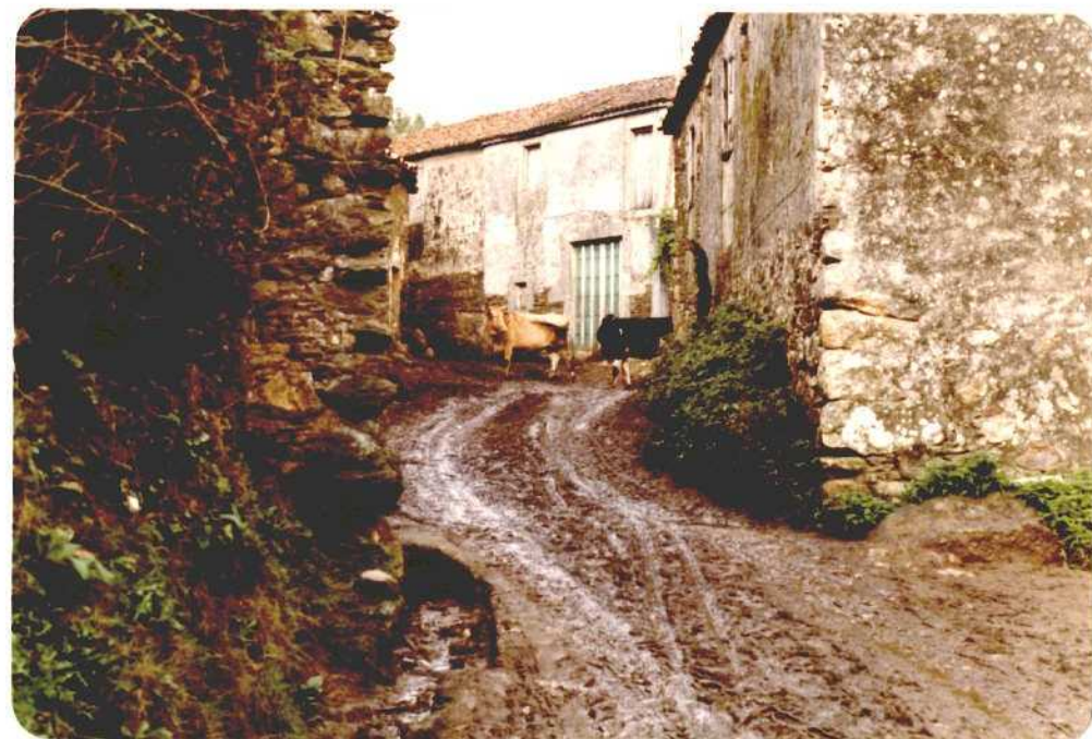
Fotografías núms. 48 y 49. Dos vistas de la calle principal de la aldea de Vilar de Soutolongo, en la parte sur del término municipal de Lalín; próxima al polígono industrial de Botos.