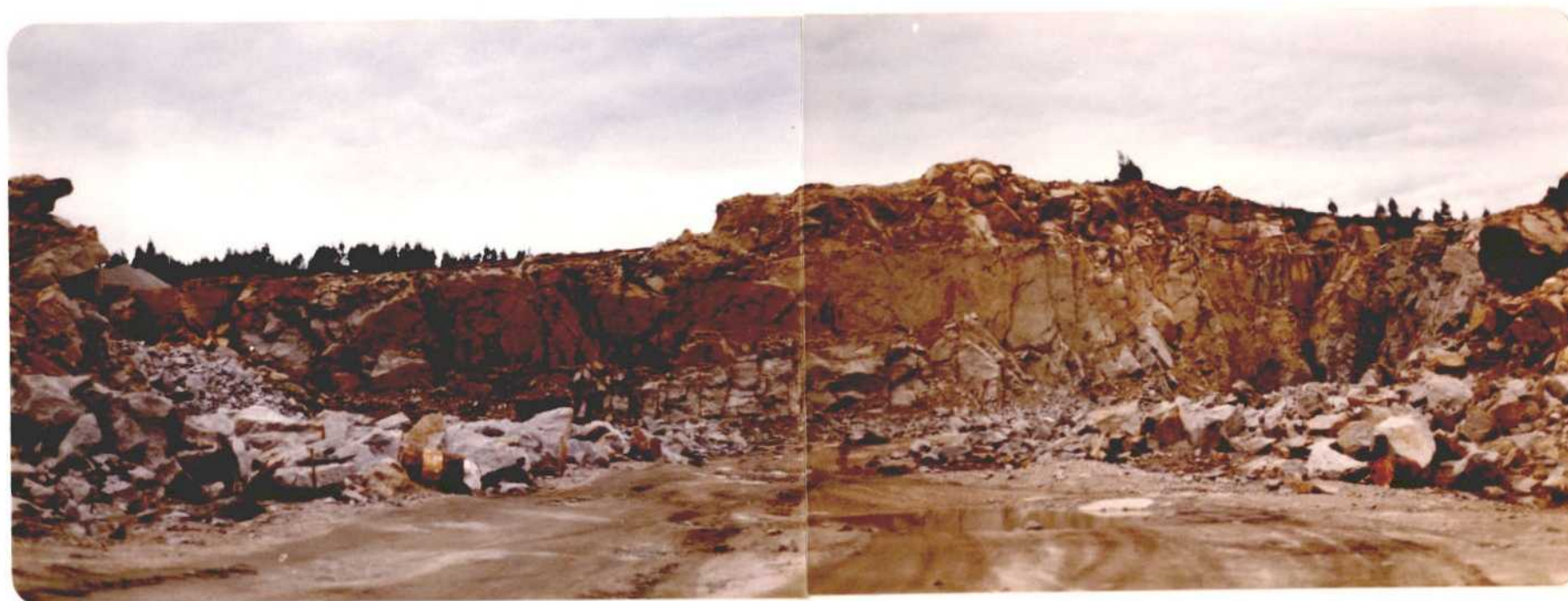
Fotografía núm. 46. Vista de la corta de la cantera de "Couso", próxima a la parroquia de Couso, en el término municipal de Puenteareas. Se explota para obtener granito que posteriormente pasa a las instalaciones de machaqueo. La producción fue en 1979 de 225.000 Tm. de granito, siendo la de mayor producción de todas las existentes en la Comarca de Acción Especial.