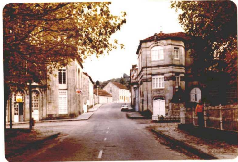
Fotografía núm. 15. Manantial y planta embotelladora de las aguas minero-medicinales de Gándara y Troncoso, aguas de Mondariz, sitas en el casco urbano de Mondariz-Balneario.