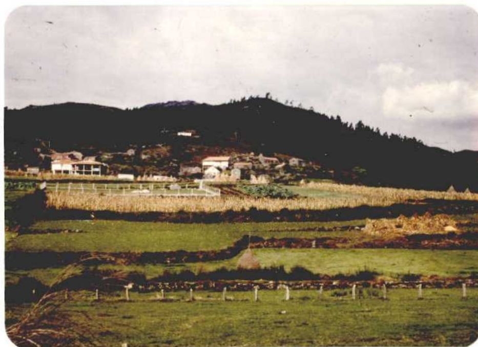
Fotografía núm. 10. Alrededores de Tourón, término municipal de Ponte-Caldelas, distante 12 km. de Pontevedra. Una gran parte de la población activa trabaja en la ciudad, con el consiguiente aumento en el nivel de vida. La construcción de nuevas viviendas en la zona rural es consecuencia de ello, y de la vuelta de los emigrantes.