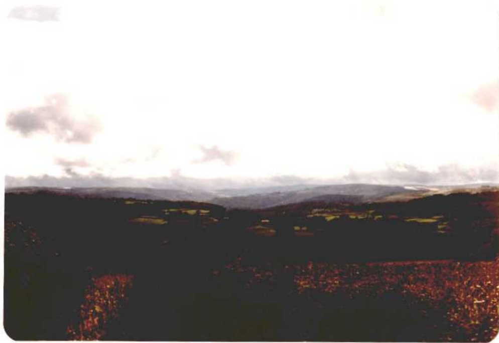
Fotografía núm. 23. Parroquia de Donsión, al oeste del pueblo de Lalín. Ferrocarril Orense-Santiago, que cruza la Comarca en su parte norte.