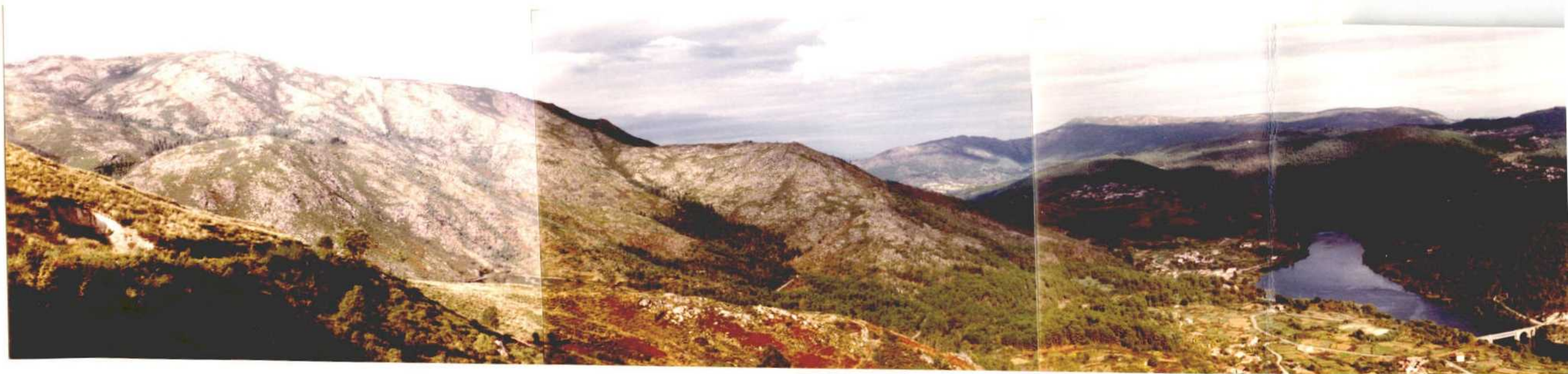
Fotografía núms. 27. Vista panorámica del río Miño, Creciente y a la izquierda los montes que separan las provincias de Orense y Pontevedra. Observese el escaso desarrollo de llanura aluvial dadas las abruptas pendientes de los maci-- zos rocosos laterales prácticamente sin egetación, sólo con pequeños núcleos de frondosas.