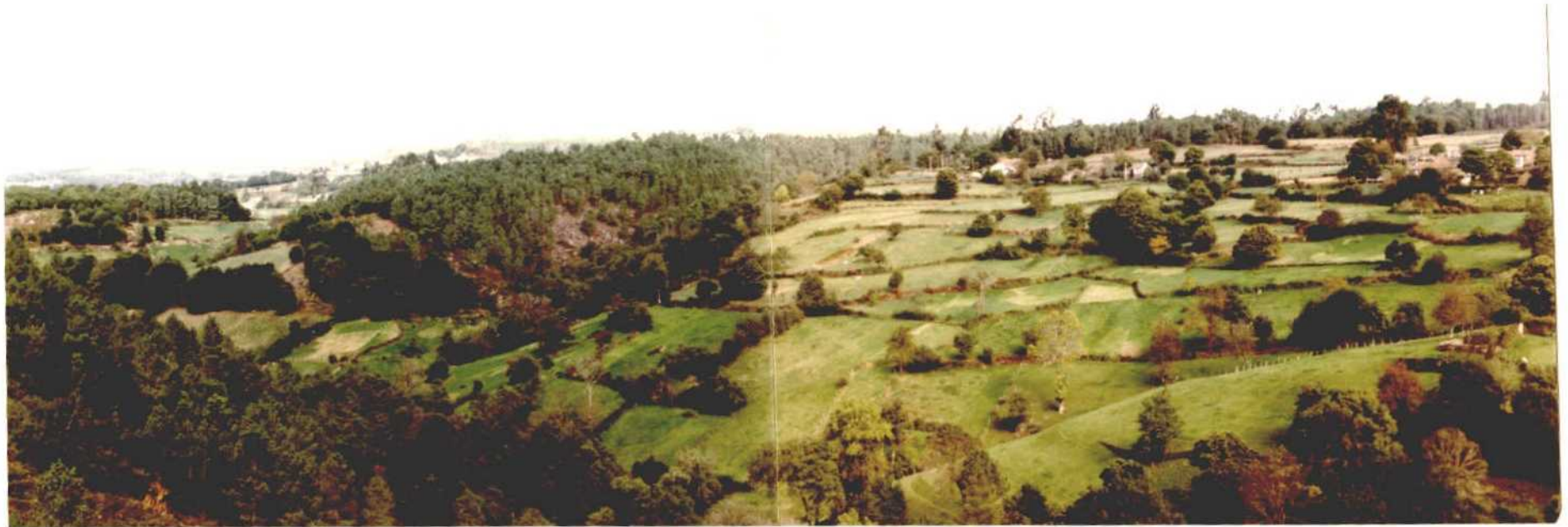
Fotografía núm. 8. Tierras del DEza. El aprovechamiento de la superficie es total, distribuyéndose en praderas y bosques. Las primeras como sustento para la ganadería, siendo los bosques el potencial económico familiar para hacer frente a alguna necesidad.