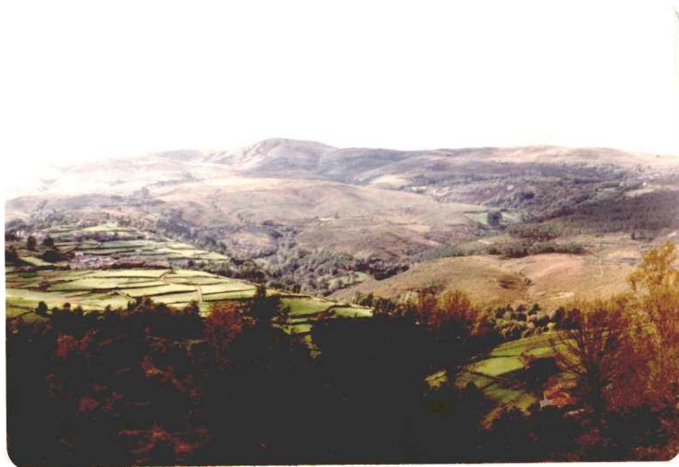
Fotografía núm. 4. Vista del término municipal de Cotobad, realizada desde la parroquia de Sacos (San Jorge y Santa María), en la carretera a Orense, nacional 541.