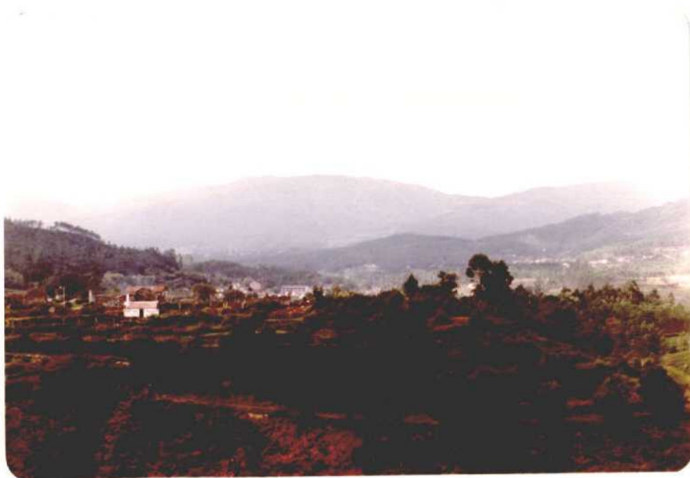
Fotografía núm. 16. Vista del término municipal de Mondariz Balneario y el valle del Chabriña en la unión con el Tea. Realizada desde la carretera de Mondariz a Villasabroso.