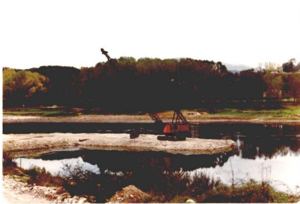
Fotografía núm. 44. Dragalina para extracción de cantos rodados del río Miño. Pertenece a las instalaciones de "Aridos Teanes", término municipal de Salvatierra de Miño, con una producción de 60.000 Tm/año, que la sitúa entre las tres de mayor tamaño de todas las existentes en la parte del río que entra dentro del área de estudio. Estas canteras poseen únicamente instalaciones para el lavado y clasificación de cantos rodados, no realizándose trituración de los materiales.